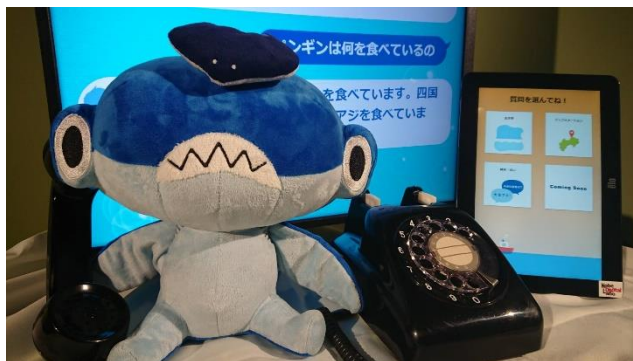
黒電話型マイクを通して質問を受け付ける

『AI shAlne』は、来館者に黒電話を通じて水族館の生きものなどに関する質問をしていただき、あらかじめ登録した解説文から最適な回答を音声で提供するものです。同時に、周囲の方にも情報が共有できるよう、展示するディスプレイ上にチャット形式のやり取りを表示します。