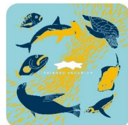
ミニタオルプレゼント