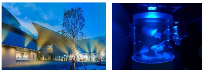
光の演出イメージ

18時から水槽ライティングやイルミネーションなど特別な空間演出で幻想的な世界へと誘います。