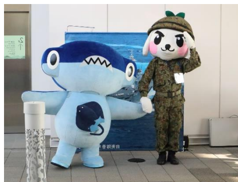
前回の館内イベントの様子

※当館では、業種別ガイドラインに沿った新型コロナウイルス感染防止対策を実施しています。館内では感染防止対策にご協力ください。また、ご来館についてはお住まい（生活圏）の自治体要請状況を踏まえてご判断下さい。感染拡大状況によっては、一部展示・プログラムを中止することがあります。