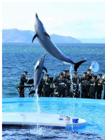
昨年開催したイベントの様子

陸上自衛隊第14音楽隊の活動を知っていただくとともに、1日限りの特別なプログラムをお楽しみください。