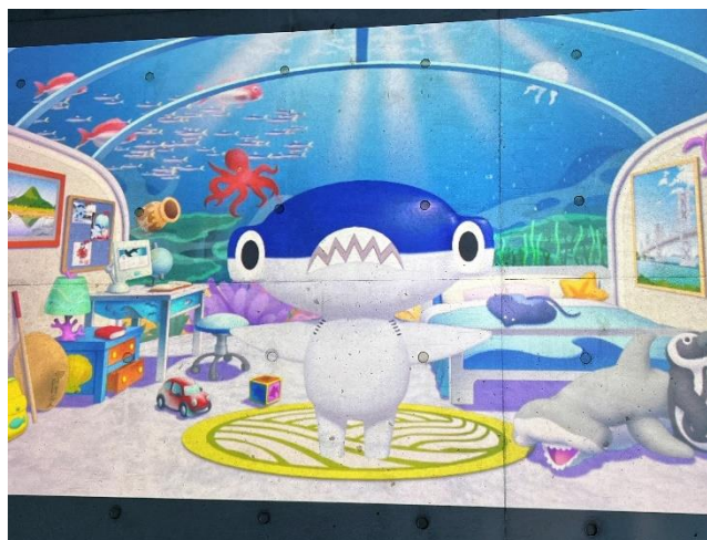
アニメーションになった「しゅこくん」