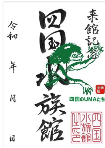
③ 企画展四国のUMAたち河童