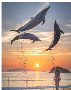
「サンセットジャンプ」