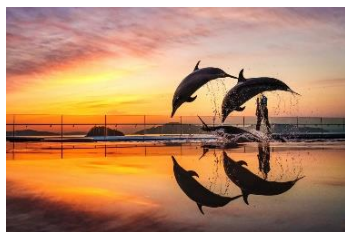
「夕暮れヘジャンプ」