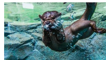
「ズッキュン ♥ ナズナちゃん！」