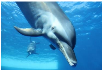
「マダライルカと見つめ合う」