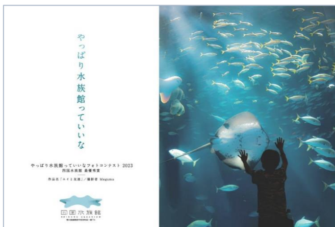
掲出ポスターデザイン

四国水族館（館長：松沢 慶将 所在地：香川県綾歌郡宇多津町浜一番丁4）は、「やっぱり水族館っていいなフォトコンテスト2023」四国水族館部門の最優秀作品を2023年12月1日（金）～2024年1月31日（水）の期間、高松空港（所在地：香川県高松市香南町岡 1312 番地 7）2階国内線コンコース吊下げポスター広告として掲出しています。