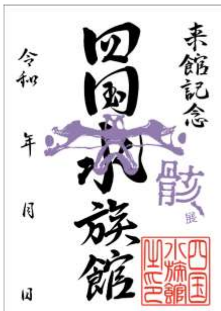
シュモクザメ頭骨デザイン