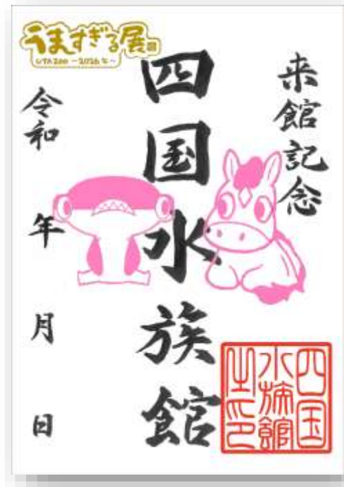
うますぎる展デザイン魚朱印（イメージ）