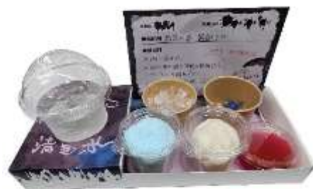
禁忌の毒 調合実験ソーダ （イメージ）