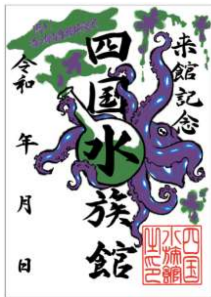
『潜入！海の有毒生物研究所』デザイン魚朱印 （イメージ）