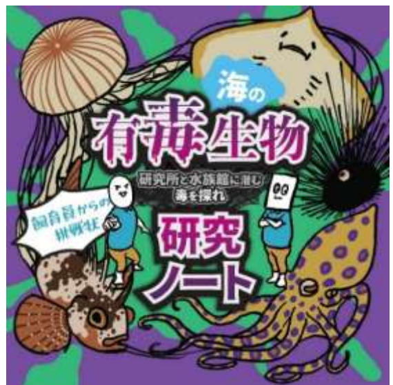
海の有毒生物研究ノート 表紙（イメージ）