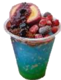
混ぜるな危険!?猛毒の泉 （イメージ）